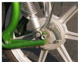
Emsige Modellpflege: Gussräder gehörten 1977 zum guten Ton, bald auch Scheibenbremsen