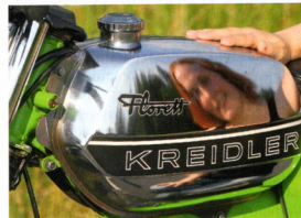
Jennifer Platz: „Auf dem komplett verchromten Tank sieht man ja jeden Fingerabdruck!“