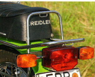
Das große Kreidler-Rücklicht erntet auch im Hercules-Lager Anerkennung