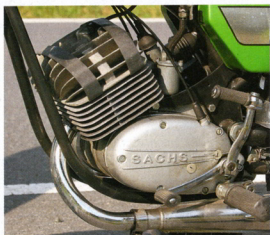
Fränkische Verbindung: Hercules setzte auf den zigtausendfach bewährten Sachs-Motor