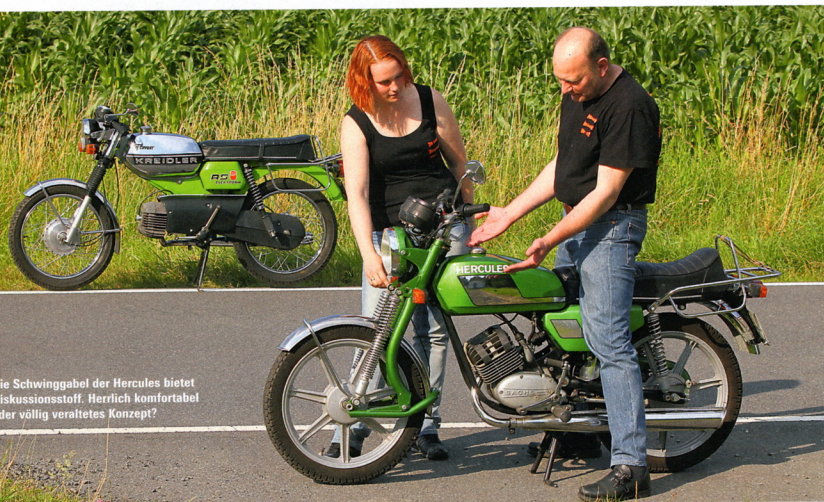
Die Schwinggabel der Hercules bietet Diskussionsstoff. Herrlich komfortabel oder völlig veraltetes Konzept?